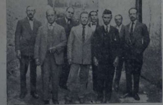
MIEMBROS DEL DIRECTORIO DE LA COOPERATIVA DE IMPRESA "La Lucha".

Orden del día del congreso 1º Designación de la comisión de poderes y consideración de los mismos. 2º Elección de la mesa directiva. 3º Reglamento de discusión. 4º Designación de comisiones. 5º Consideración del informe de la Junta Ejecutiva. 6º Consideración del informe de la administración y dirección de "El Socialista". 7º Consideración del informe de la comisión pro Casa del Pueblo. 8º Consideración del informe de la comisión de prensa. 9º Consideración de las proposiciones. 10º Clausura del congreso.