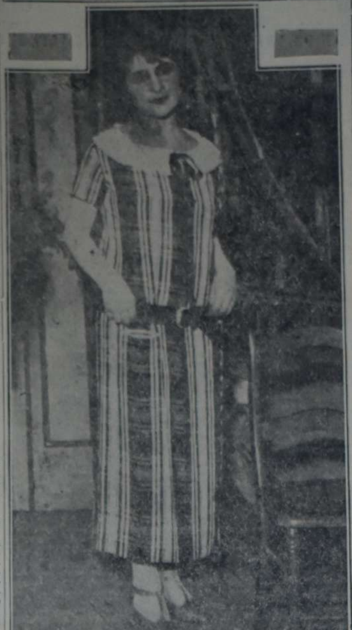
LA EXCELENTE ACTRIZ ITALIANA MARIA MELATO, QUE ACTUALMENTE TRIUNFA EN EL MANZONI, DE MILAN, Y QUE ESTE AÑO NOS VISITARA NUEVAMENTE.