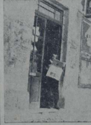
FRENTE DE LA PROPIEDAD ADQUIRIDA PARA LEVANTAR LA futura Casa del Pueblo.